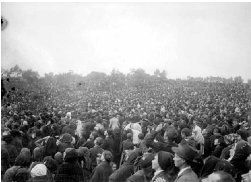
Ci-dessus : une foule de près 70 000 personnes était rassemblée à la Cova da Iria le samedi 13 octobre 1917, à midi heure solaire, pour assister au miracle annoncé par la Vierge Marie (l'« entité » qui prit ce statut). Ce dernier point est un fait unique dans les annales de la sémiologie ovnienne : l'annonce faite trois mois à l'avance qu'un événement spectaculaire et